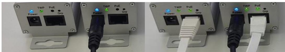
Oba převodníky jsou vzájemně propojeny